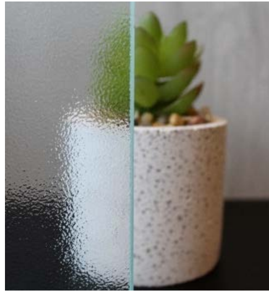
Прозрачное декоративное стекло CREPI