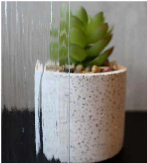
Прозрачное декоративное стекло KURA