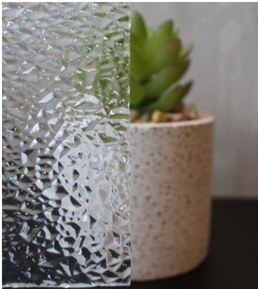
Прозрачное декоративное стекло RAAKA (Diamante)